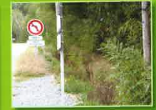
bord de route

Le diagnostic et le suivi de territoire sont essentiels.