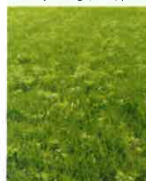
Ambrosie dans une prairie nouvellement implantée.

Une fois fauchée, la plante repousse et est capable de produire des graines. Il faut veiller à surveiller le développement de l'ambrosie pour réaliser plusieurs fauches en abaissant la hauteur de coupe à chaque passage.