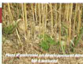
Plants d'ambrosie en développement dans une culture à maïs.