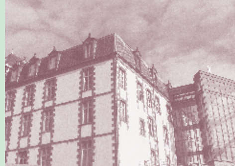
Collège Michel-de-L'Hospital - Riom