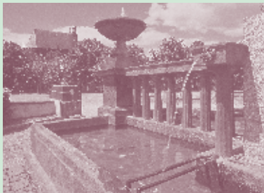
Fontaine Desaix, Pré Madame - Riom