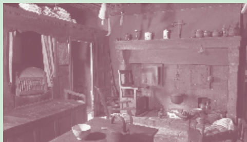
Intérieur auvergnat, Musée régional d'Auvergne - Riom

MUSÉE RÉGIONAL D'Auvergne Le musée régional d'Auvergne ouvre ses portes du 22 mai au 11 novembre et le Pays d'art et d'histoire vous invite à le découvrir.