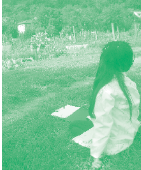
Lecture de paysage, activité nature - Enval