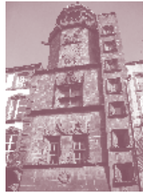
Tour de l'Horloge - Riom