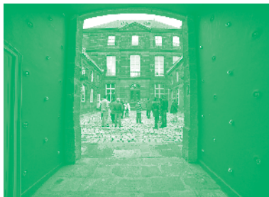
Cour d'honneur, musée Mandet - Riom.