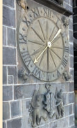
détail tour de l'Horloge