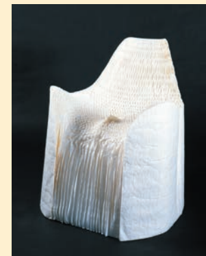
Fauteuil Honey Pop. 2001 - Papier Japon. Tokujin YOSHIOKA Centre national des arts plastiques

Les Auvergnats utilisaient l'indigo pour teindre leurs vêtements d'un bleu uni. Au Japon, la technique de teinture traditionnelle Shibori permet d'obtenir une grande variété de motifs simplement en pliant, en tordant ou en nouant le tissu avant de le plonger dans un bain de teinture, en particulier indigo. Alors si tu veux redonner de la couleur à un vêtement ou à un sac (en coton ou en lin de couleur claire), apporte-les.