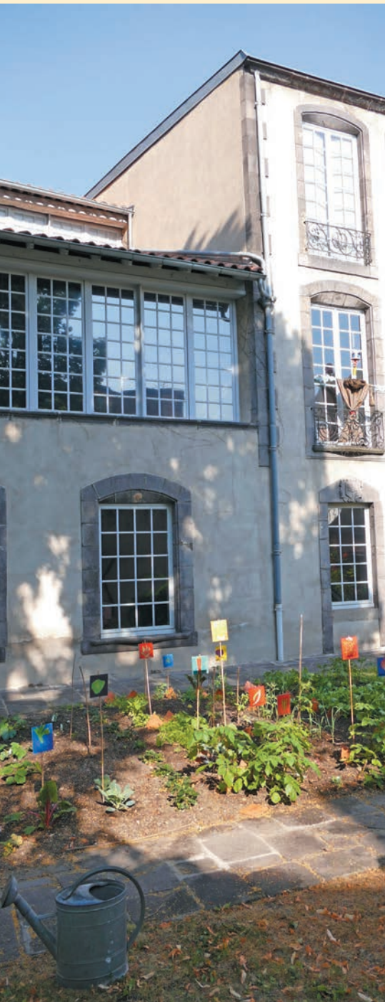
Musée régional d'Auvergne © PCommunication. Musées de Riom communauté