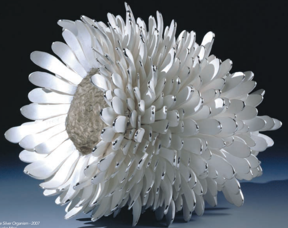
A pinecone Silver Organism - 2007 Argent - Junko Mori © Adrian Sassoan - Londres

Visites commentées Quand les objets racontent la vie des hommes elle se déroule sous vos yeux, à travers les travaux, mais aussi les rites, les fêtes et les danses au fil des saisons.